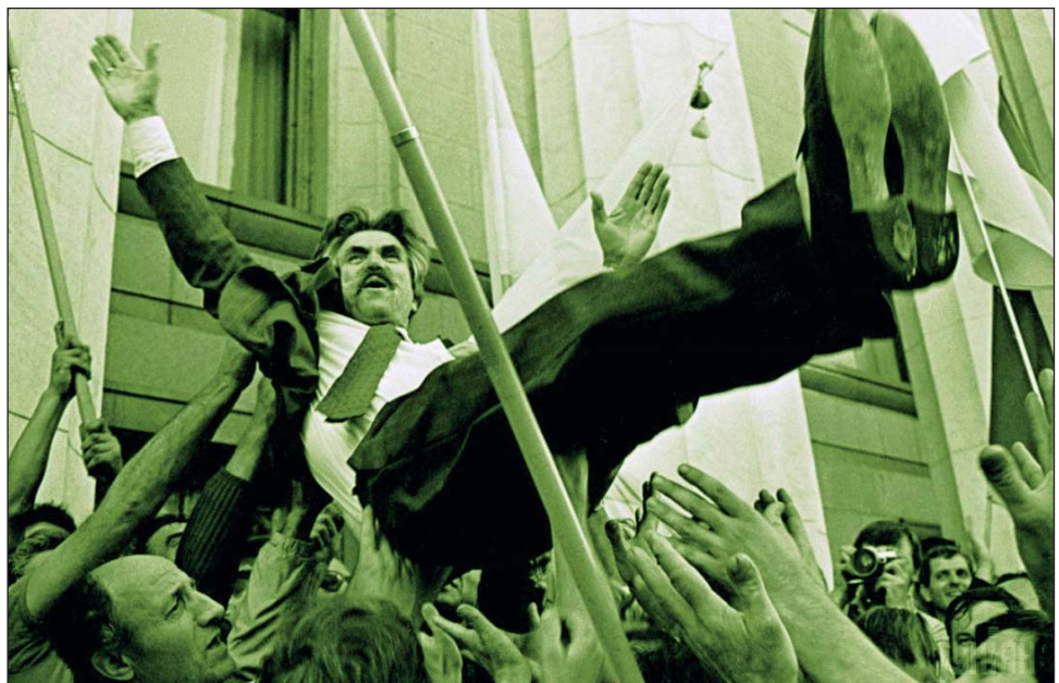
Вітання авторів Акту проголошення Незалежності України Левку Лук'яненко. 24 серпня 1991 р.

«Україні — українську національну владу!».