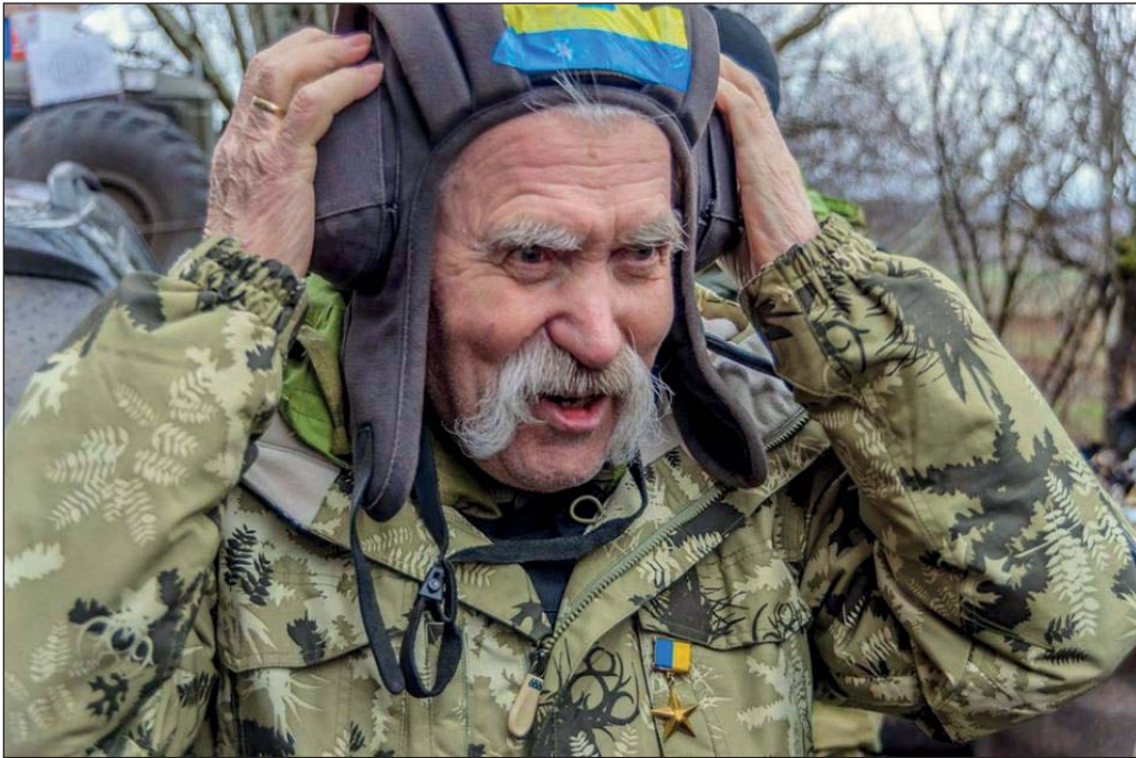
Герой України Левко Лук'яненко (1928—2018).

виборчу систему, виплекати національну політичну еліту, свідому завдань створення потужної європейської самостійної України. Усе це надзвичайно цікаво, але впевнена — дещо приховане і нині, тож спадок Левка Григоровича ще може піднести його дослідникам несподіванки.