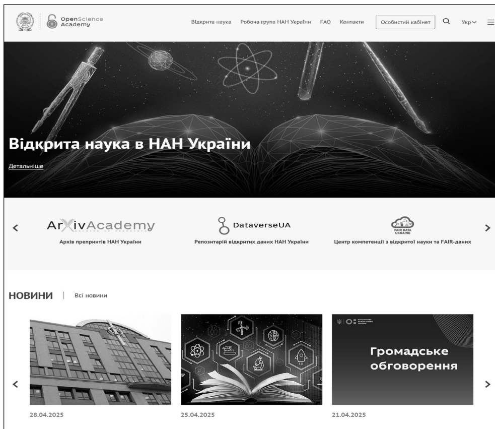
Рис. 9.1. Домашня сторінка Головного порталу відкритої науки НАН України. Перехід до підсистем Інфраструктури відкритої науки НАН України – на третьому згорі ярусі (підсистеми можна перебирати стрілочками ліворуч та праворуч)

– новини й анонси майбутніх подій, контакти, посилання на канали у соціальній мережі «Фейсбук» та на ютубі тощо (домашня сторінка, рис. 9.1);